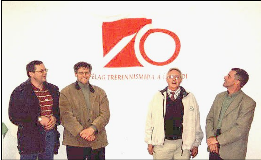
Sauðkræklingarnir sem áttu veg og vanda af sýningunni