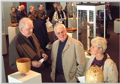
Teddi í góðum félagskap