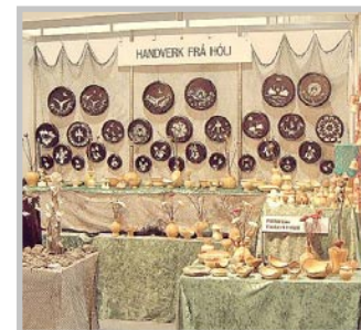
Sýningarbás hjónanna frá Hóli