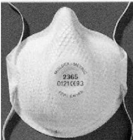
Filtgríma með plastneti, loftventli og tvöfaldri teygju.

Þá verður að nefna yfirborðsefnin, í sumum þeirra eru hættuleg rokgyjörn efni, sem geta verið varasöm og er rétt að huga vel að umhverfisáhrifum allra efna sem notuð eru.