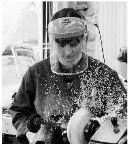
Einföld hjálmgrima getur gefið mikið öryggi. Ekki ætti að vinna við smergel án hennar!

Ein er sú hætta að patrónan eða viðfangsefnið slái í rennismiðinn eða það sem er enn hættulegra, grípi í fatnaðinn og þá getur farið illa. Allur fatnaður þarf að vera við hæfi, ermar ekki of síðar og víðar; fatnaður má ekki vera