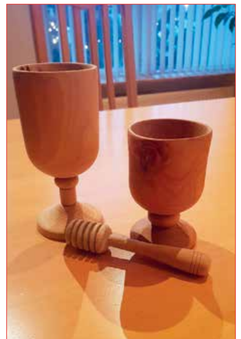
Staup og hunangssköflan