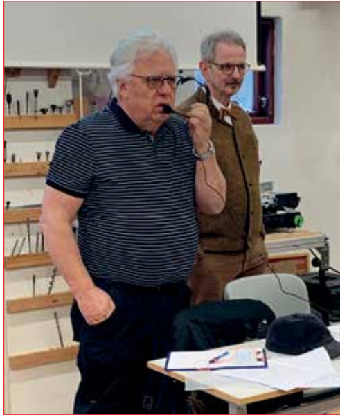
Formaður flytur ársskýrslun