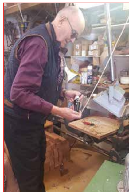
Þetta þarf að skoða nánar