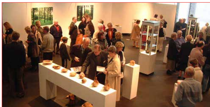
Séð yfir salinn í Ráðhúsinu

Félagsmenn hins nýstofnaða félags eu hvaðanæva af landinu, allt frá Patreksfirði til Egilsstaða, og frá Akureyri til Vestmannaeyja eins og segir í fyrsta fréttabréfi félagsins sem dagsett er 1.apríl 1995.