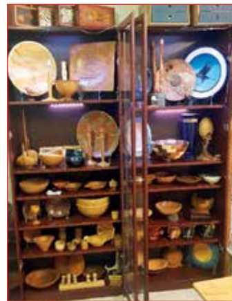
Fullir skápar af listmunum