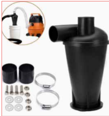
Festingar og fleira