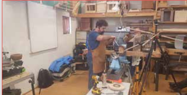
Bútahringur límdur við þann fyrsta og svo koll af kolli