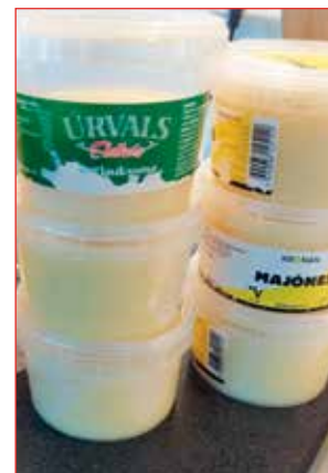
Vax í dósun