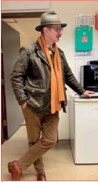
Íbygginn MUGGI gjaldkeri