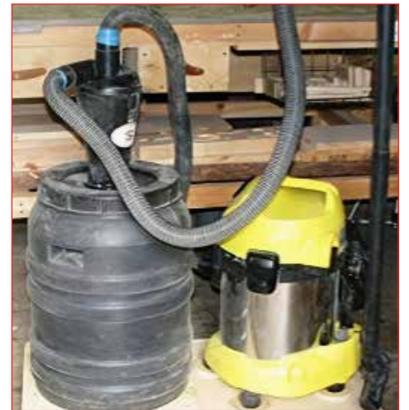
Búnaðurinn festur við tunnulok