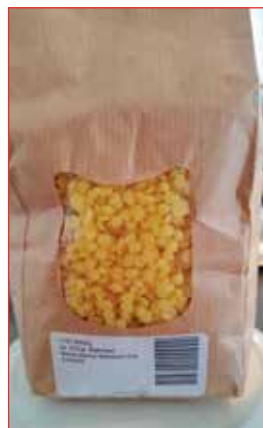
Gúmmelaði í poka