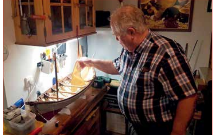
Skip í viðgerð hjá meistararum