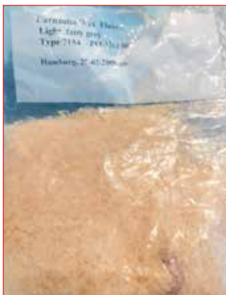
Vax í poka