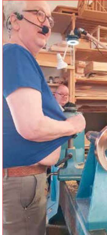
Ebbi þússar með pólóbol