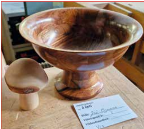
Á fæti – áskrunarverkefni október mánaðar