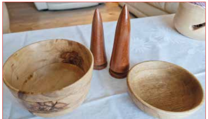
Verkefni úr bekknum