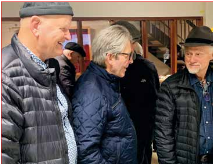
Málin rædd í kaffisal