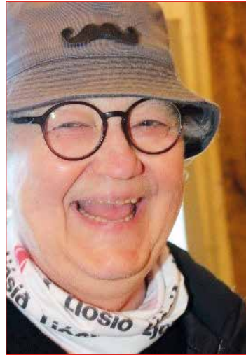
Maðurinn með hattinn

Sólin er að síga niður fyrir sjóndeildarahringinn og kaffið búið svo tímabær er að kveðja með góðum óskum um bjarta framtíð á nýja renniverkstæðinu í Kjósinni.