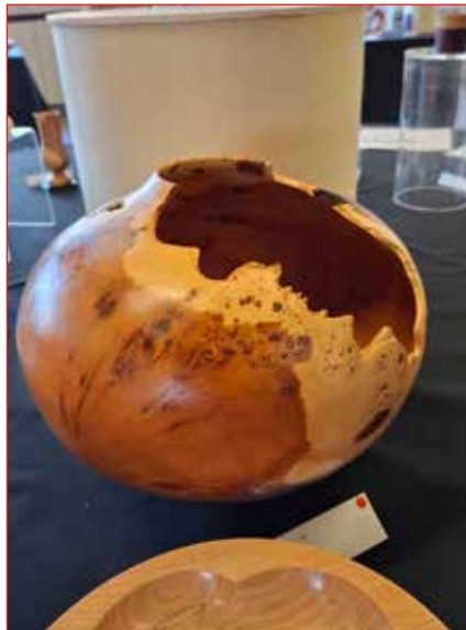
Seminar - þessi fór með heim