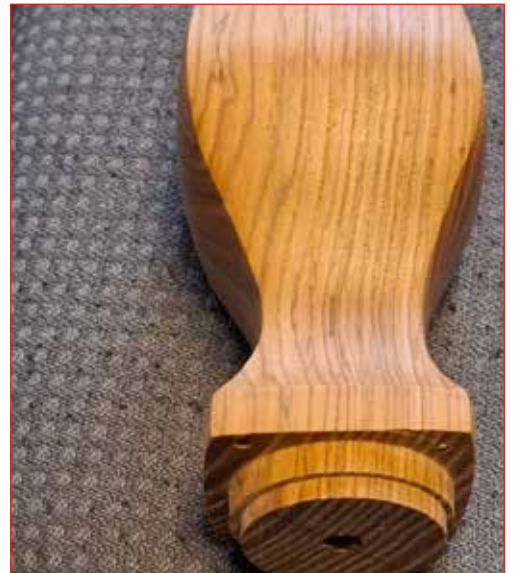
Seminar - ferkantað