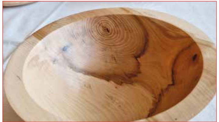
Reyniviður úr Hólavallakirkjugarði