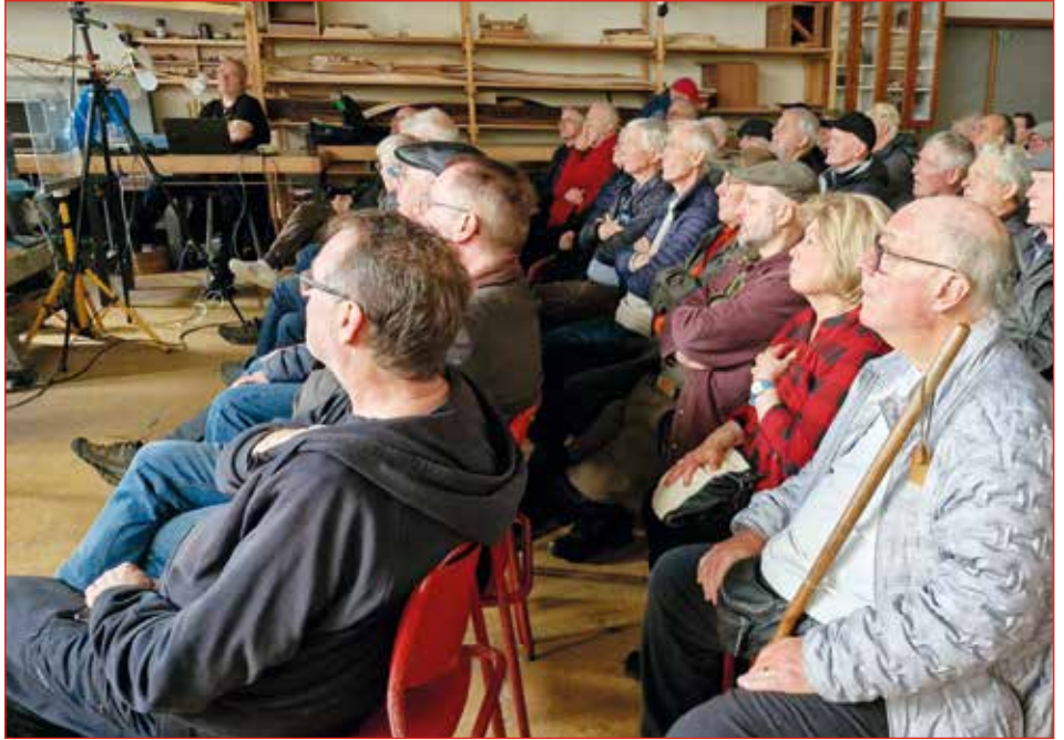
Eric rennir innanúr og allir fylgjast með