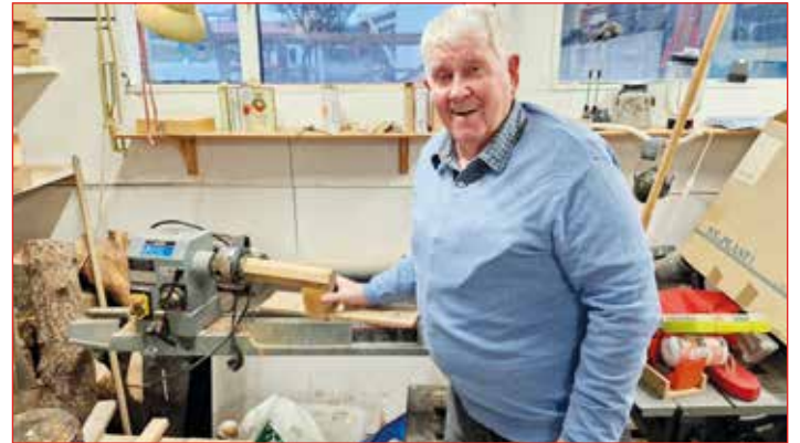
Ómar við bekkinn

Í millitíðinni gafst tími til að fara í þriggja ára Símsmiðanamám og klára það og er hjá símanum alveg fram að eftirlaunadri 67 ára.