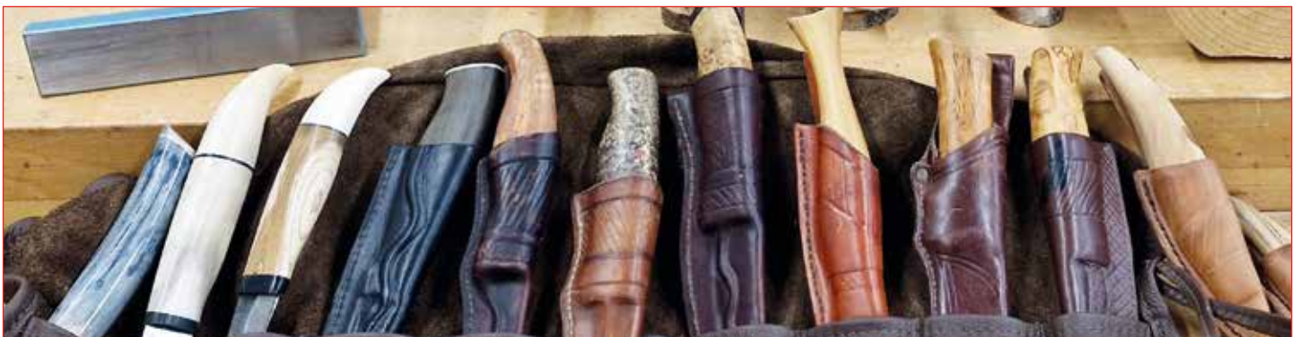
Hnífagerð er hluti af handverki félagsmanna