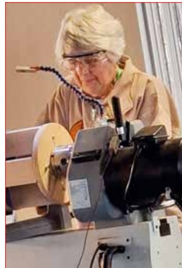
Seminar kennt að renna ferkantað