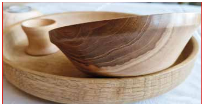
Verkefni úr bekknum