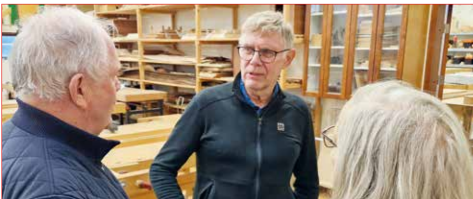
Mörg eru umræðuefnin