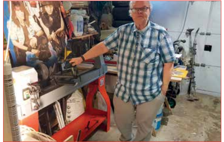
Nýi rennibekkurinn kominn upp

Þó svo að maður sé lunkinn í ýmsu þá má segja að það vanti töluvert uppá í sambandi við yfirborðsmeðferðina og ýmsu fleira eins og ég hef kynnst hjá ykkur snillingunum í trérennifélaginu á fundunum. Framanaf voru verkefnið lituð, lökkuð eða máluð.