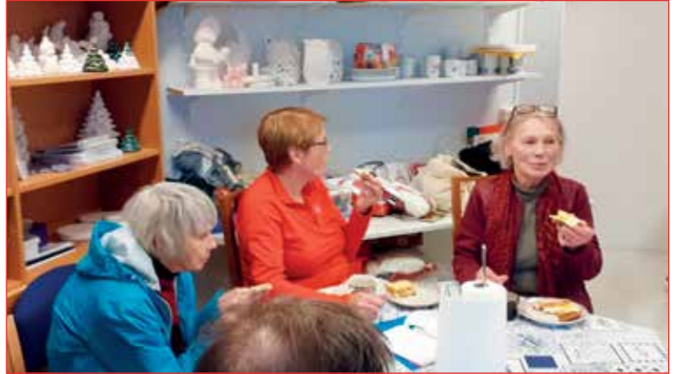
Veitingar á Hólmavík.