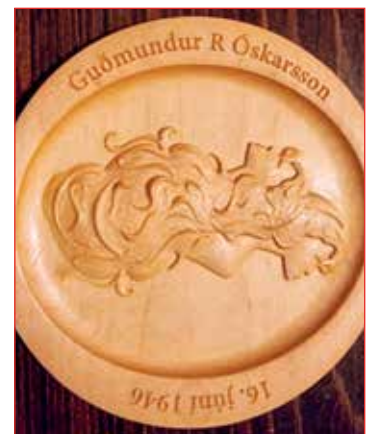
3 D fræsing