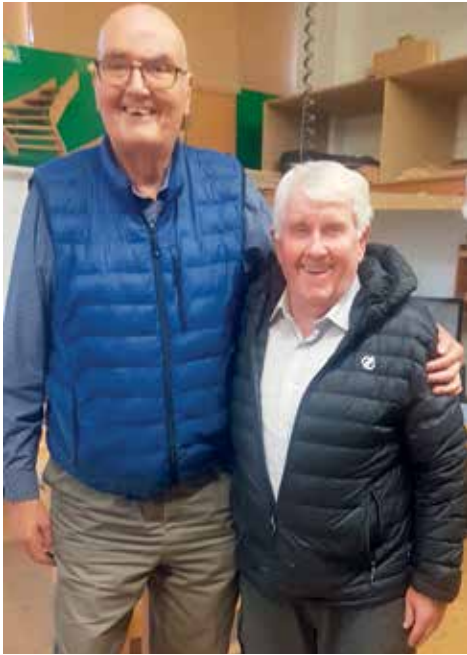
Háir sem lágir.