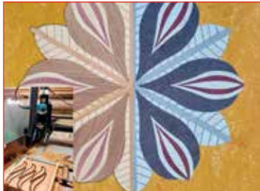
Verkefni í vinnslu.