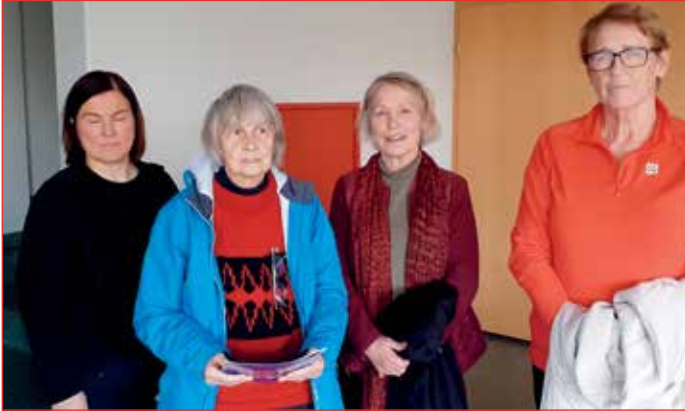
Þær komu frá Reykhólum til Hólmavíkur.