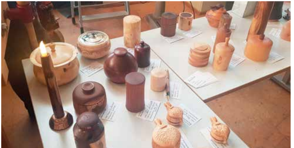
Enn meira af boxum.