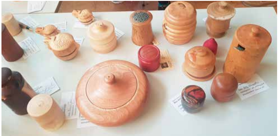
Allskonar box með loki.