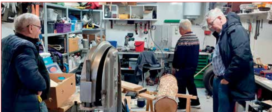
Í skúr á Ísafirði.