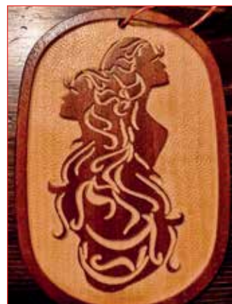
2 D fræsing.