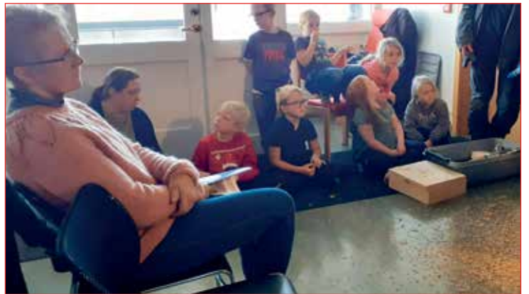
Börnin komu líka á Hólmavíkur.