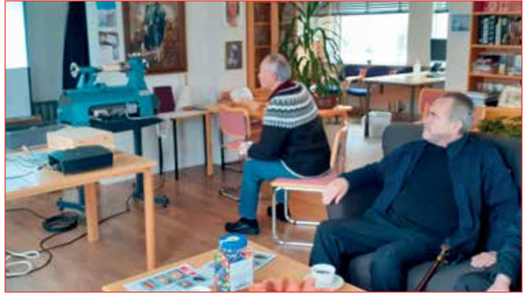
Fyrirlestur á Suðureyri.