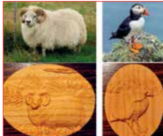
Verkefni í þróun.

Þar sem það var ekki ýkjamiðið sem ég þurfti að bæta við mig í húsgagnasmíðinni lauk ég því skólagöngunni í húsgagnasmíðinni og útskrifaðist frá Tækniskólanum 2018, Ég sagði einmitt við kennarana mína að ég væri að læra húsgagnasmíðina til að geta fönðrað af fagmennsku í bílskúrnum.