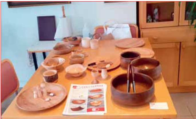
Verk á Suðureyri.