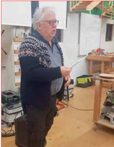
Örn formaður heldur tölu.