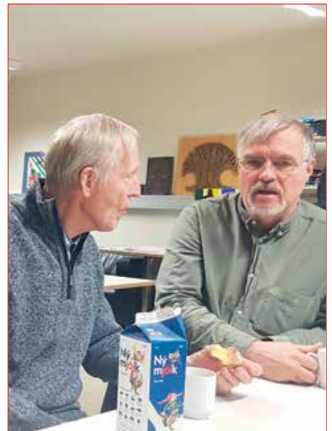
Vínarbrauðsstund rennara er partur af hittingnum.