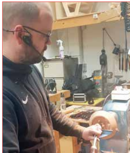
Andri rennir á fundi.