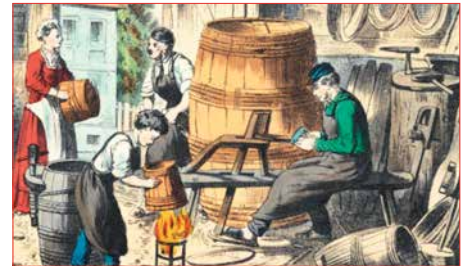
Beykir að störfum.