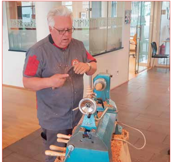
Formaður kynnrir trérennsli hjá Félagi eldri borgara í Garðabæ.