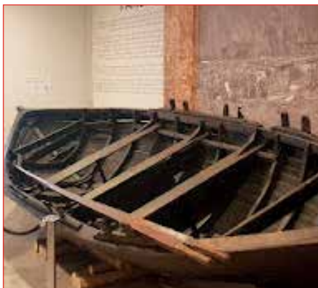
Farsæll í anddyri Visku.