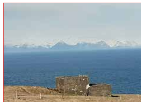
Horft til Íslands frá Stórhöfða.