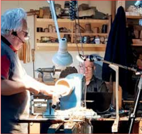
Formaður rennir víkingaskál.