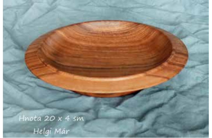
Hnota 20 x 4 sm Helgi Már