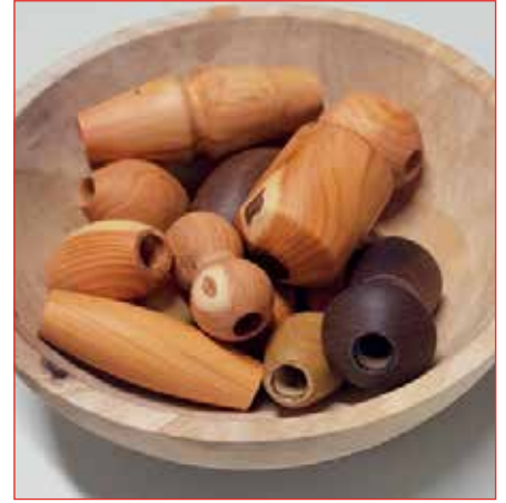
Smáhlutir í skál.