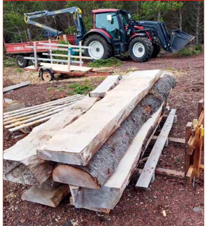
Timbur á Snæfoksstöðum.

Ég mæli eindregið með að félagar í Félagi trérennismiða geri sér ferð þarna austur og ekki sakar ef menn taka sig saman og hafa gaman í leiðinni. Það er vel þess virði.