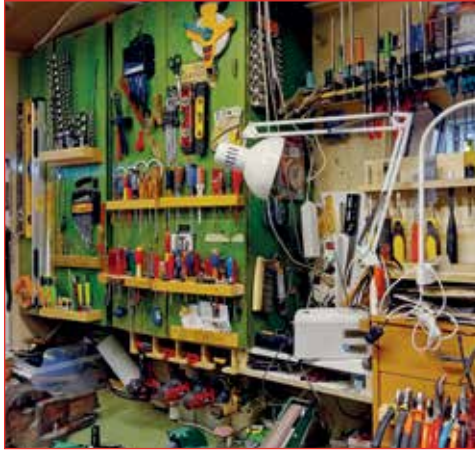
Verkfæri í skúr.