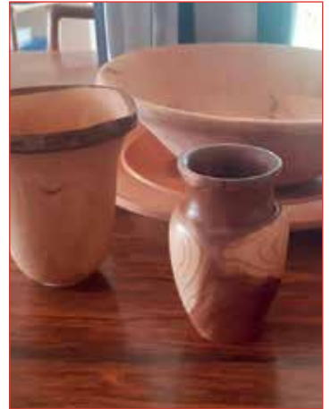
Vasar og skálar.