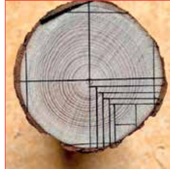
Kvartsögun í undirbúningi.