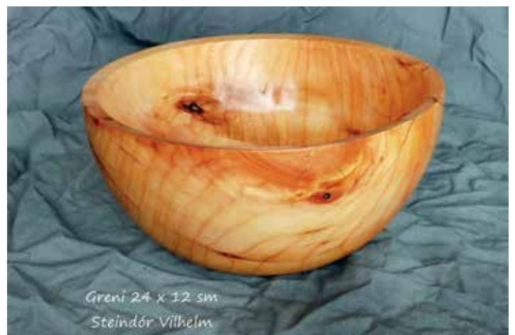
Greni 24 x 12 sm Steindór Vilhelm