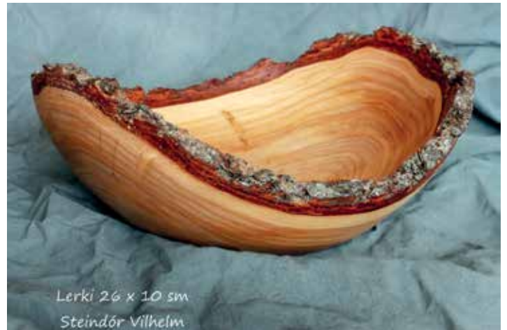
Lerki 26 x 10 sm Steindór Vilhelm