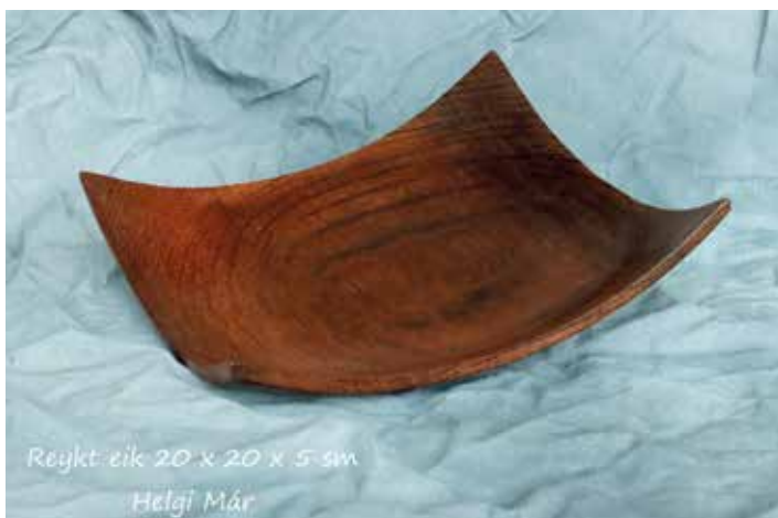
Reykt eik 20 x 20 x 5 sm Helgi Már