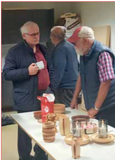
Vínarbrauðs og kaffistund á fundi.