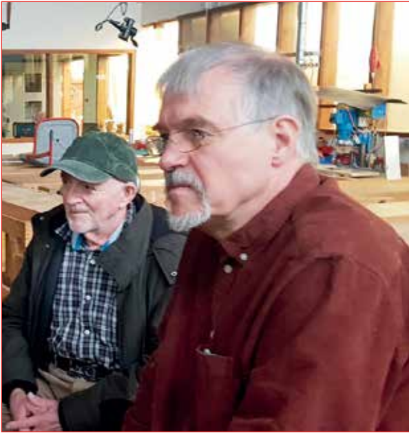
Athyglin er fullkomin.