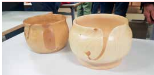
Smíðsgripir á kaffistofu.