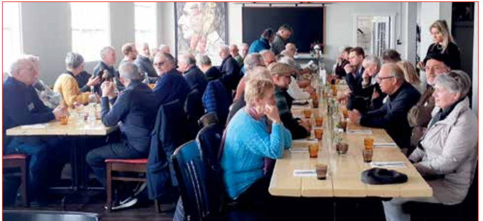
Matast í Slippnum.

Frá Visku var haldið í veitingahúsið Slippinn sem er í húsi sem fyrrum hýsti vélsmiðjuna Magna sem eftir gos varð hluti af Skípalayftunni er smiðjurnar Magni og Völundur sameinuðust.