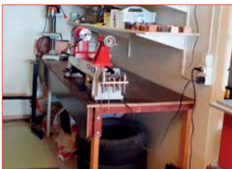
Renniverkstæði séra Viðars - hvergi ryk.