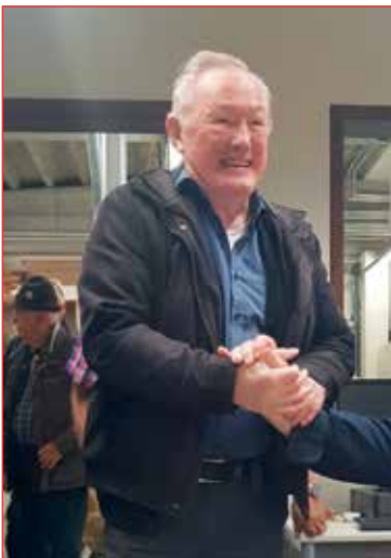
Alltaf kátur hann Guðmundur.