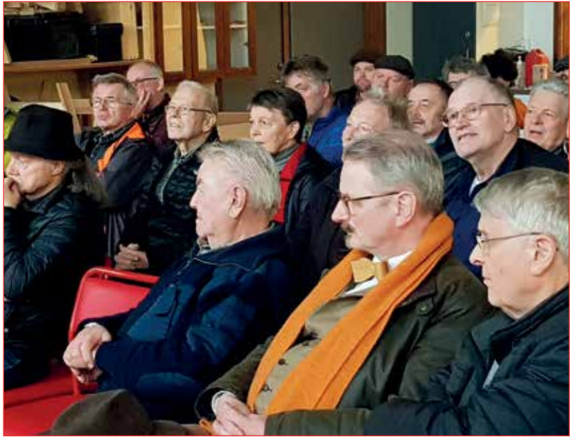
Íbyggirnir félagar á fundi.