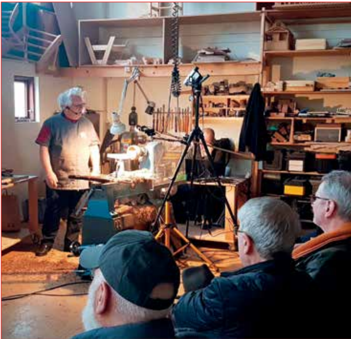
Víkingaskál verður til.