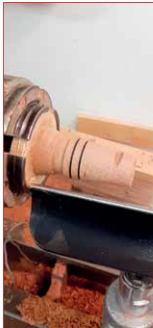
Verk í patrónu.