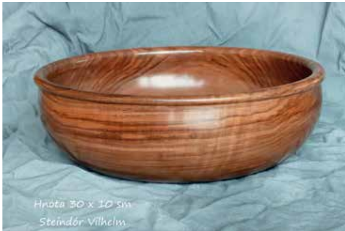
Hnota 30 x 10 sm Steindór Vilhelm