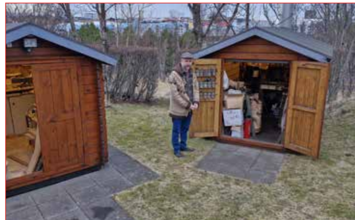
Handverkshúsin á baklóðinni.

Eftir Gaggann lá leiðin í tækniteikun í lönskólanum en síða eða árið 1993 þá orðinn 26 ára hélt okkar maður til Bretlands, nánar tiltekið til Bournemouth þar sem tveggja ára nám í ljósmyndun var verkefnið. Þetta var nokkuð stór og samheldinn hópur sem var þarna í námi og heldur enn nokkuð saman.