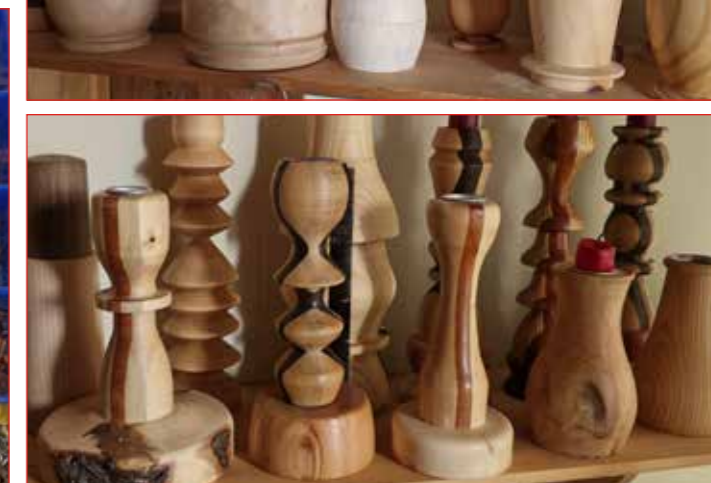
Smíðisgripir um allt.