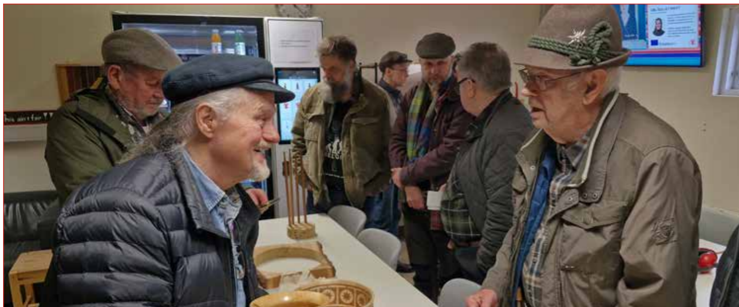
Málin rædd yfir kaffibolla.