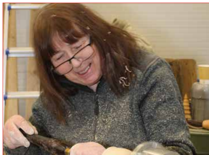
Auðvitað eru konurnar líka í rennslinu.