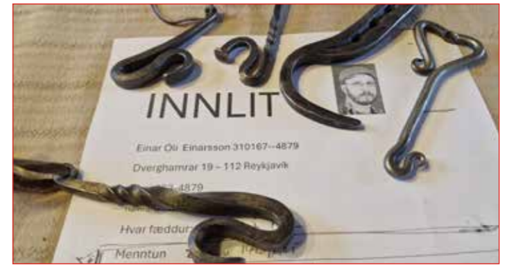
Smíðisgripir úr eldsmiðjunni.