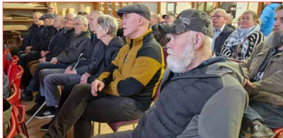
Her er sko fylgst með af athgli.