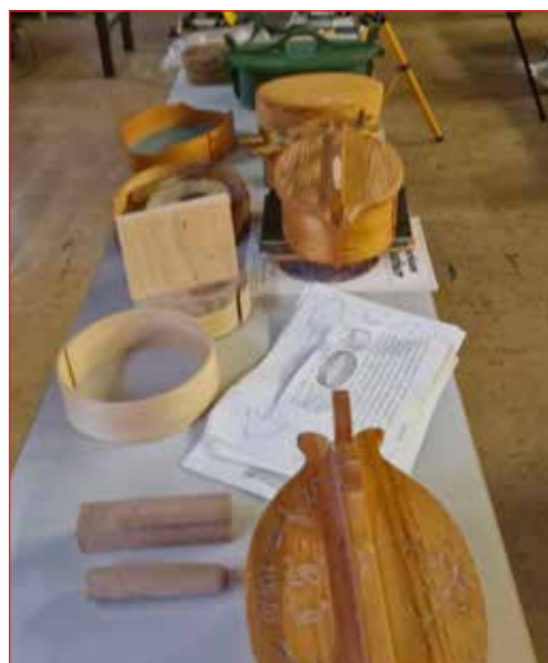
TRAVAÖSKJUR geymslubox fyrri tíma.