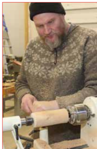
Einbeittni á Blönduósi.