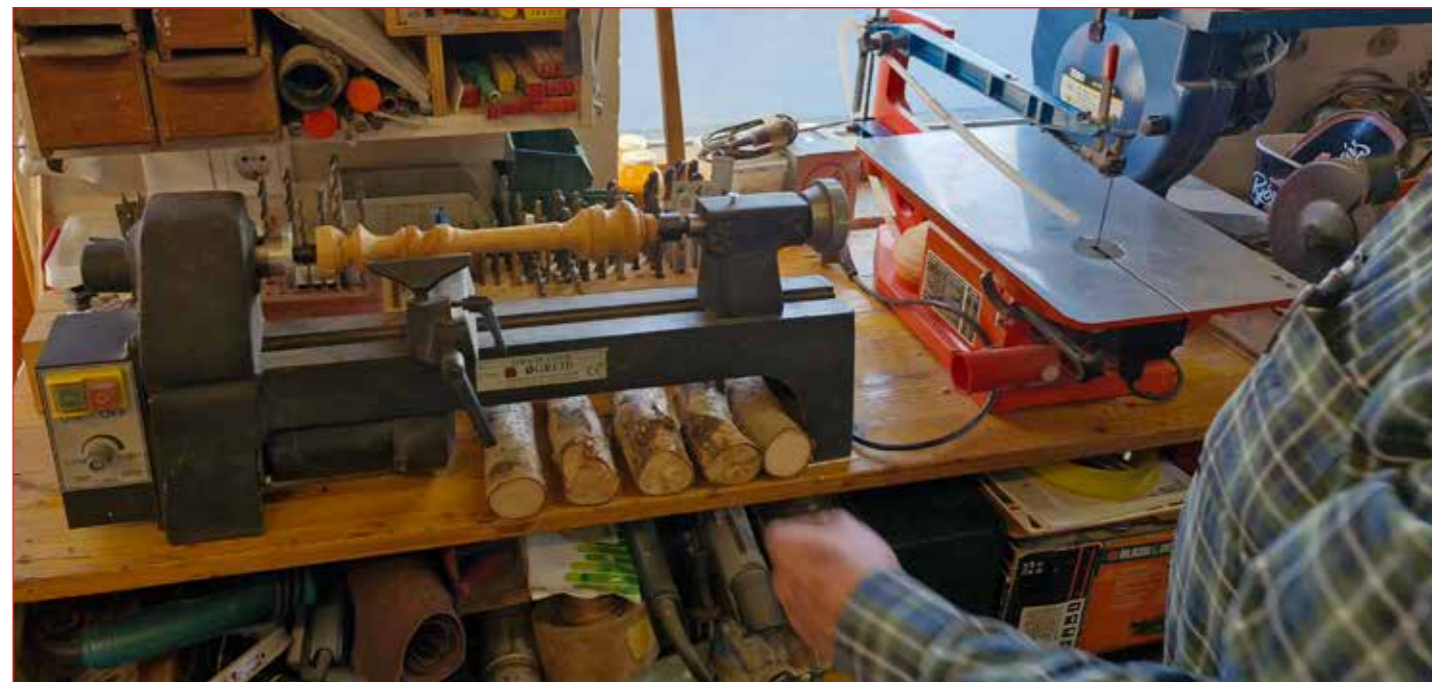
Meistarinn í einu horninu

Enginn skortur á verkefnum, allstaðar verið að byggja og t.d. var Breiðholtið að rýsa á þessum árum og ég byggði okkur heimili einmitt þar.