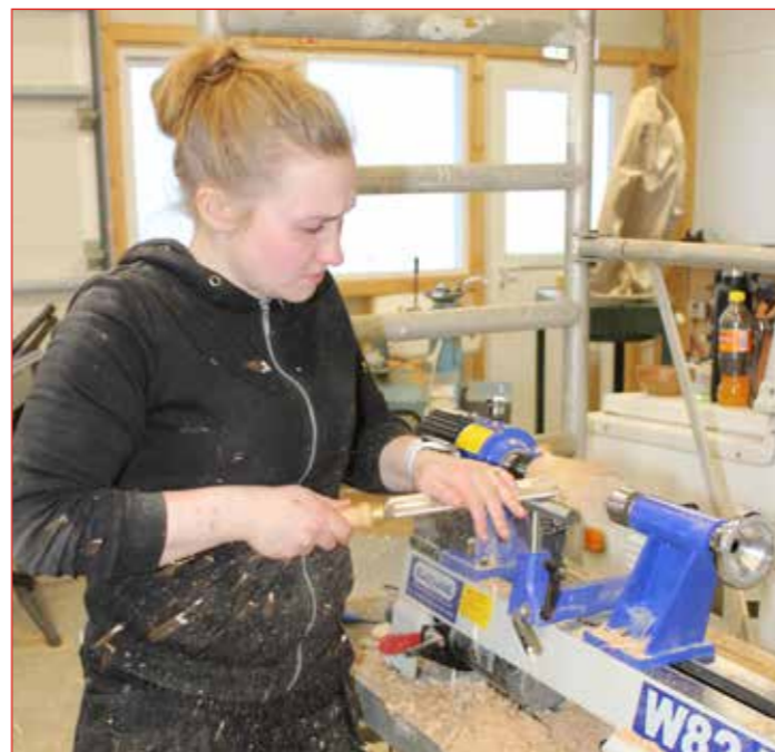
Kvenþjófir létu sig ekki vanta.

Við Binni vorum ánægðir með námskeiðin og vonum að nemendurnir séu sama sinnis. Eftir fjóra góða daga á Blönduósi þökkum við saman og brunuðum suður. Enn var Hrutafjörðurinn hulinn myrkri, langur og lognfagur.