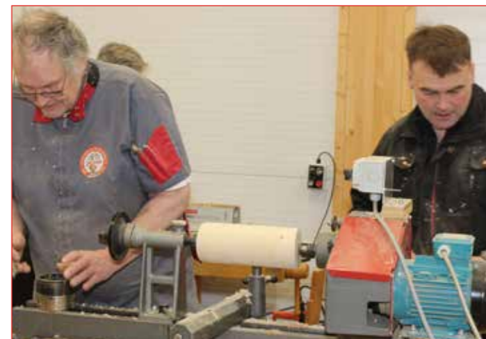
Einbeittir á Blönduósi.