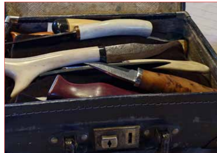
Gömul taska full af hnífum.

Ég veit að þú drakkst í þig handverkið af samvistum við föður þinn sem var mikill handverksmaður en hvar kemur aðild þín að Félag Trérennsmiða? Það bara leiddi eitt af öðru, ég fór t.d. á sýningu Félagsins í Ráðhúsi Reykjavíkur og heillaðist af því sem þar bar fyrir augu og það var eitthvað fyrir mig því ég hef alltaf haft mikinn áhuga á að gera eitthvað með höndunum.