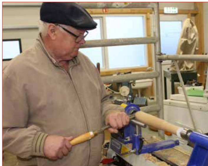
Hér skal vanda verkið.

Fyrri dagur námskeiðs fór í þessar grundvallaræfingar en seinni daginn gáfum við nemendum lausan tauminn og hver og einn fékk að spreyta sig á viðfangsefnum að eigin vali.